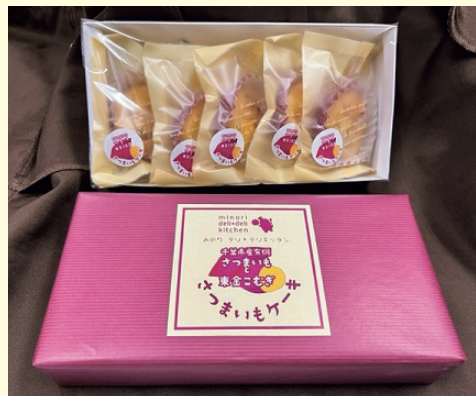
さつまいもケーキ