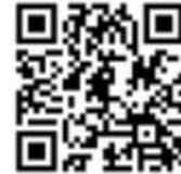
▲参加申込フォーム