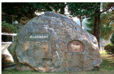
嶺岡乳牛研究所前に設置されている「日本酪農発祥之地」の記念碑

明治44年に同社は解散し、現在跡地には嶺岡乳牛研究所が作られ、千葉県の酪農研究や指導拠点としてその名を残しています。