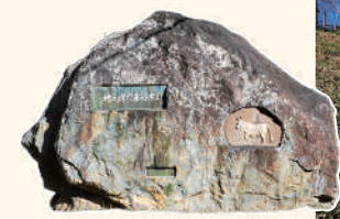
日本の酪农发源地纪念碑