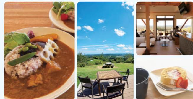
长南丸咖喱饭 900日元(含税)