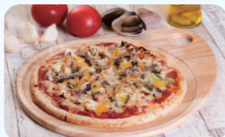
ALBA99 (Sunrise九十九里直营) ALBA99披萨 1,600日元(含税)

2F 备有露台坐席，天气晴朗的日子里，可以一边眺望海边的风景，一边享用新鲜的海鲜。