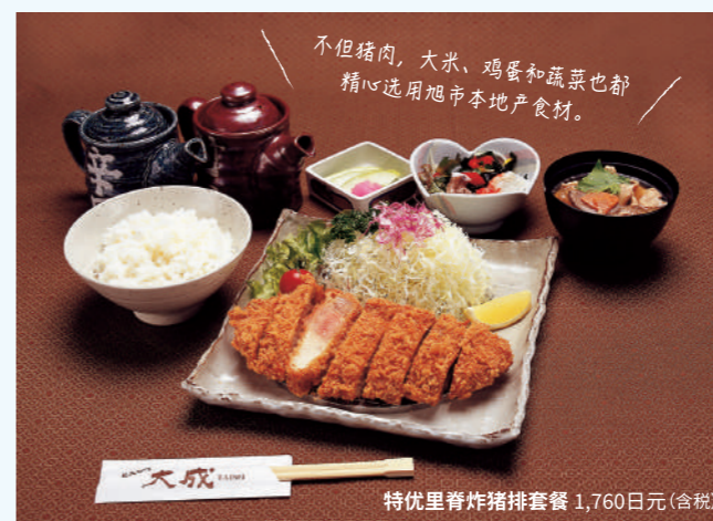
特优里脊炸猪排套餐 1,760日元(含税)