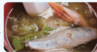
九十九里舟方汤(味噌口味) 495日元(含税)