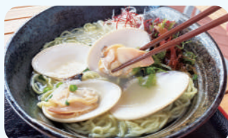
叶武里 (Sunrise九十九里直营) 文蛤拉面 990日元(含税)

2F 备有露台坐席，天气晴朗的日子里，可以一边眺望海边的风景，一边享用新鲜的海鲜。