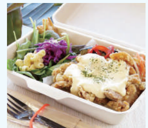
Chicken Box/Cheese 880日元(含税)

以鸡肉为主， 配以本地的蔬菜和新鲜食材， 是一款色彩丰富、 赏心悦目又美味的午餐盒饭。