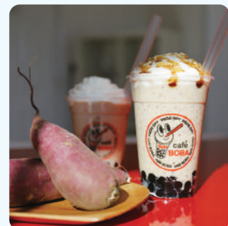
有机红薯珍珠思慕雪 722日元(不含税)