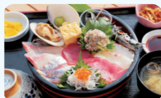
叶武里 (Sunrise九十九里直营) 海鲜桶散寿司 1,500日元(含税)

1. 酱油口味桃子产沙丁鱼罐头 540日元(含税) / 2~5. 寒菊铭酿 本地啤酒 407日元(含税)、3. 皮尔森啤酒 407日元(含税)、4. 淡色艾尔啤酒 407日元(含税)、5. 南房总柠檬啤酒 550日元(含税) / 6. 海之驿咖喱 700日元(含税)