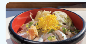
沙丁鱼盖饭 1,010日元(含税)