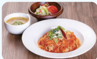
ALBA99 (Sunrise九十九里直营) 蛤与大地 1,250日元(含税)