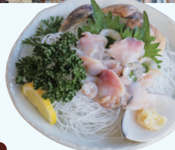
文蛤刺身 1,980日元(含税)