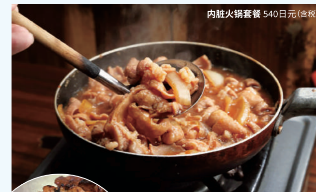
内脏火锅套餐 540日元(含税)