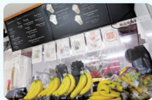
有机非油果珍珠思慕雪 722日元(不含税)