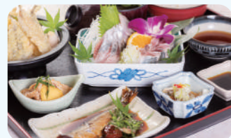
九十九里海鲜料理 我的店 沙丁鱼御膳 1,500日元(含税)