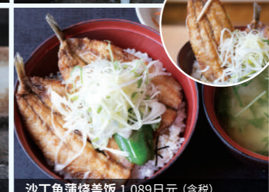
沙丁鱼蒲烧盖饭 1,089日元(含税)