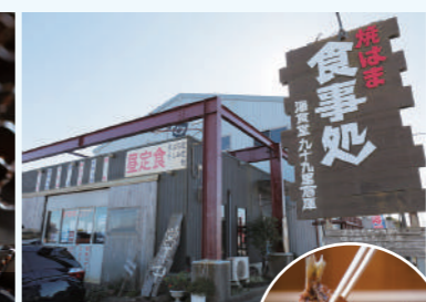
盐渍沙丁鱼发酵寿司 748日元(含税)