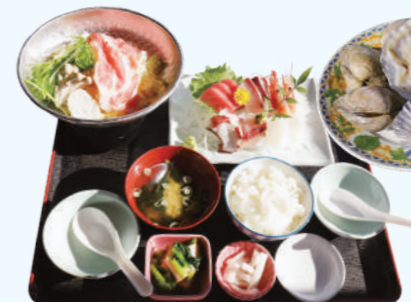
网元刺身御膳 1,740日元(含税)