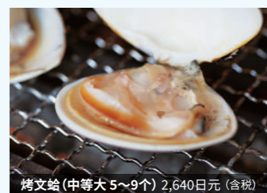
烤文蛤(中等大5~9个) 2,640日元(含税)