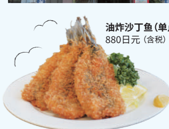
油炸沙丁鱼(单点) 880日元(含税)