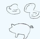
嫩煎猪排(300g) 1,540日元(含税)