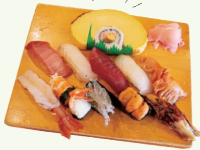
附伊达卷寿司的 Omakase(无菜单)握寿司 3,300日元(含税)