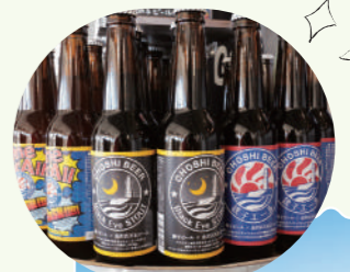
桃子啤酒 One for All SMaSH 600日元(含税)