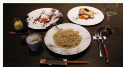
季节荞麦面膳 2,500日元(不含税)