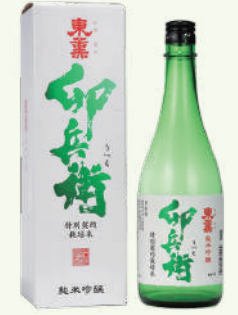
纯米吟醸 卯兵卫 720ml 1,490日元(含税)