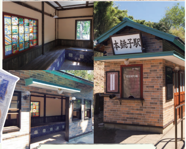
桃子地铁的怀旧风景