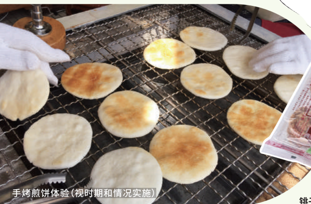
桃子地铁湿煎饼 5片装 (红色浓郁口味、绿色甜味、蓝色清淡口味) 各/450日元(含税)

为了弥补桃子地铁的铁路运输收入的减少，铁路工作人员发明并销售了这款湿煎饼。如今已经是深受喜爱的桃子名产了！利用了桃子特产酱油鲜味的柔软煎饼。