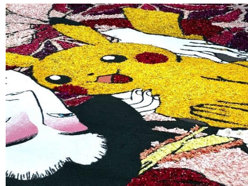
ピカチュウは「菊の花びら」で制作 されていました！