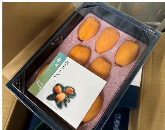
温室種なしびわ「 きぼう 希房」2 L規格の化粧箱