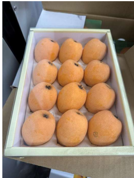
温室びわ「 みずほ 瑞穂」3 L規格の化粧箱