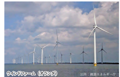
ウインドファーム (オランダ)