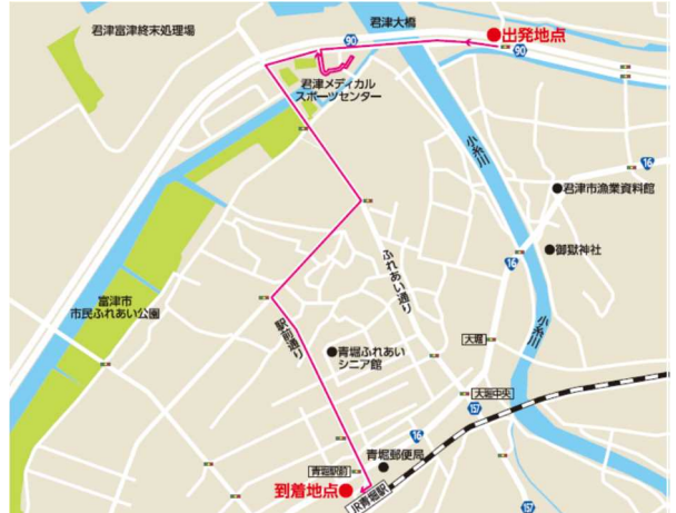
2 区間 君津大橋手前～青堀駅ロータリー