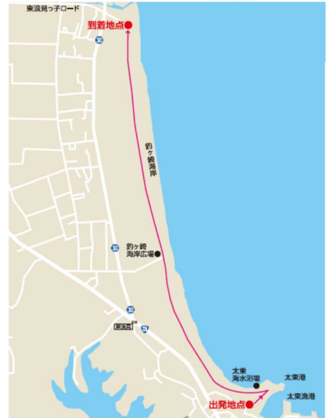
4 区間 太東海水浴場～釣ヶ崎海岸【砂浜を走行】