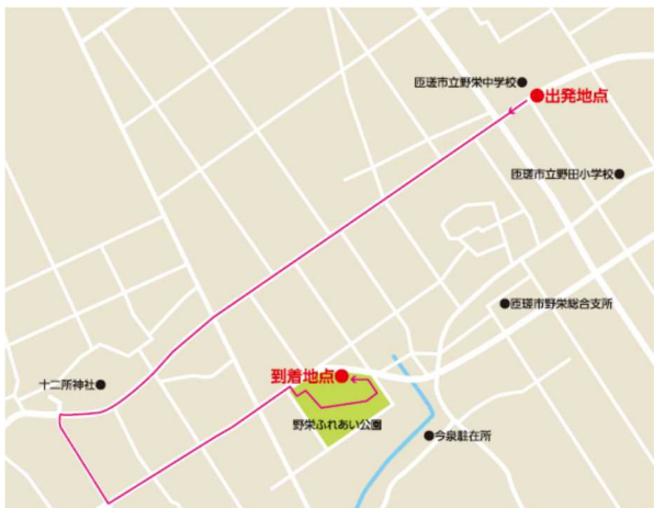
5 区間 匝瑳市立野栄中学校～野栄ふれあい公園