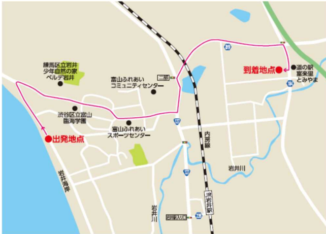
3 区間 岩井海岸～道の駅富楽里とみやま