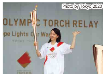
最初のランナーのトーチに点火

【日時】 7月1日(木) 15時から18時まで 【場所】 蓮沼海浜公園第2 駐車場 (山武市)