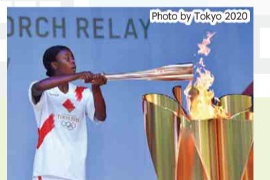
最終ランナーが聖火皿に点火