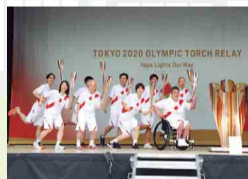
トーチキス後、みんなでポーズ

【日時】 7月3日(土) 15時から18時まで 【場所】 松戸中央公園 (松戸市)