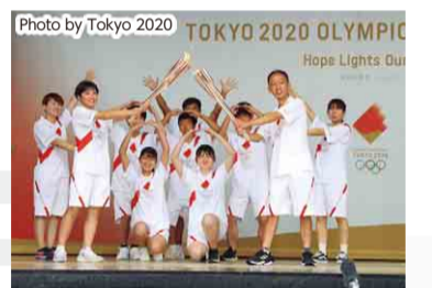
グループランナー(旭市)のトーチキス

【日時】 7月3日(土) 15時から18時まで 【場所】 松戸中央公園 (松戸市)