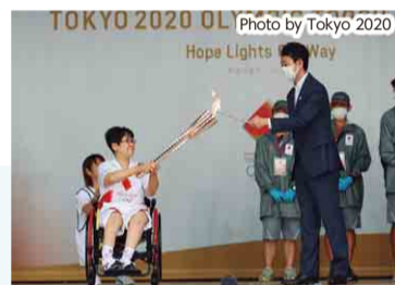
熊谷知事がランナーのトーチに点火

【日時】 7月2日(金) 15時から18時まで 【場所】 幕張メッセ駐車場 (千葉市)