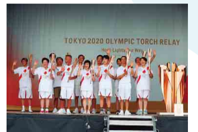
トーチキス後のフォトセッション

【日時】 7月2日(金) 15時から18時まで 【場所】 幕張メッセ駐車場 (千葉市)