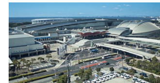
幕張メッセ Makuhari Messe