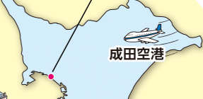
東京湾 アクアライン