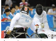
車いすフェンシング Wheelchair Fencing