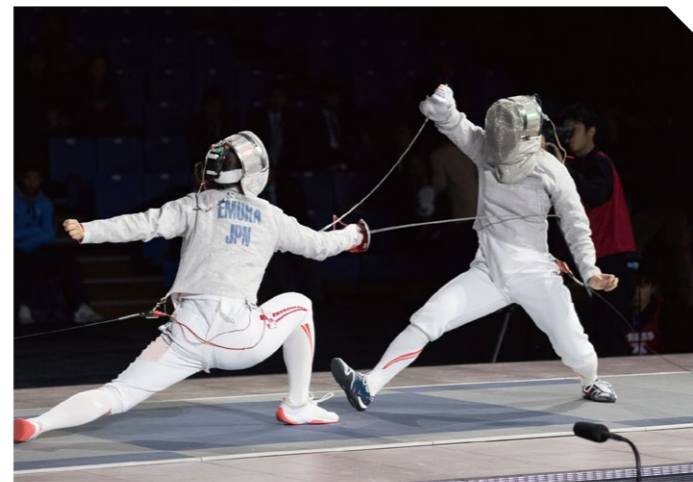
協力：公益社団法人日本フェンシング協会

ピストと呼ばれる長方形の試合場の中で2人が互いに向き合い、武器(剣)を用いて攻撃または防御を行う競技。使用する武器(剣)と防具には電気回路が埋め込まれており、攻撃が成功するとランプが点灯する。「フルーレ」、「エペ」、「サーブル」の3種目がある。