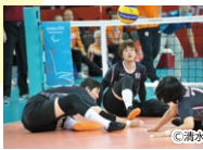
シットリングバレーボール Sitting Volleyball