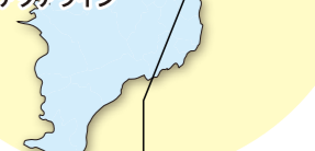
釣ヶ崎海岸サーフィンビーチ (一宮町)