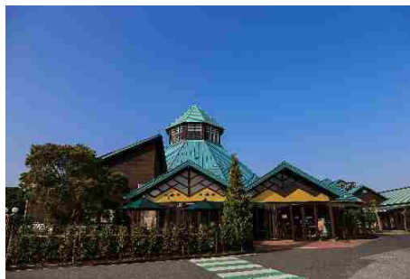
全国一の数を誇る農林水産物直売所