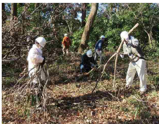
市民活動団体による里山整備活動