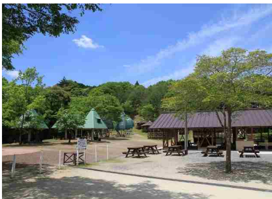
清和県民の森ロッジ村（君津市）