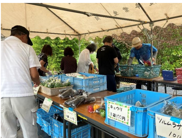
直売所での対面販売