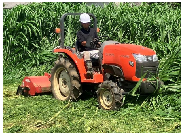
緑肥のすき込み作業