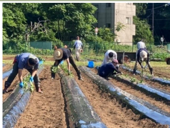
さつまいもの植え付け作業