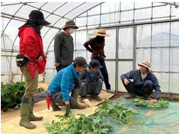
すいかの整枝作業