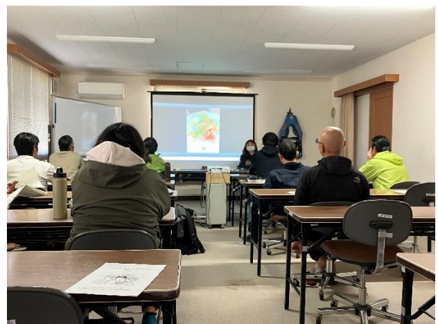
プロジェクト実習・農家実習の報告会