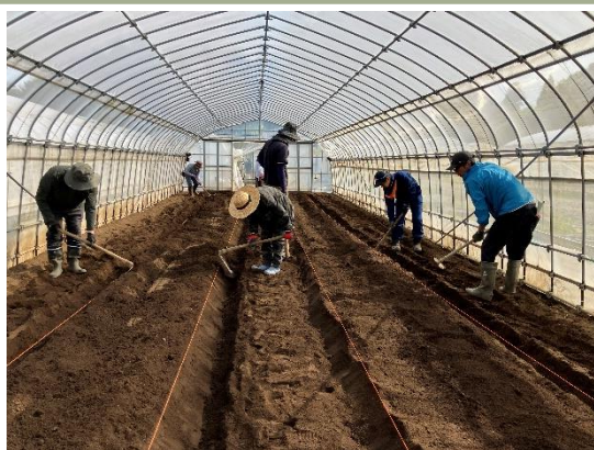
ビニールハウス内のベッド作成