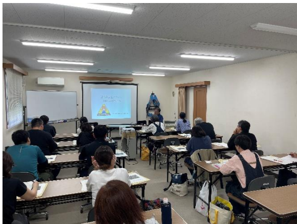
農作業事故の実態と防止対策の講義