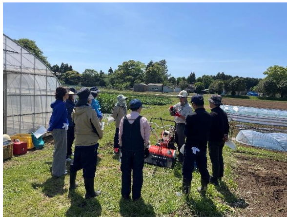
管理機の手入れについて