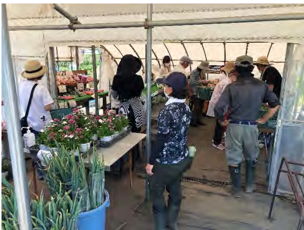
直売所での対面販売