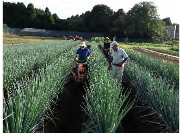
ネギの土寄せ作業