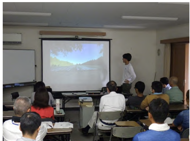
プロジェクト実習・農家実習の報告会