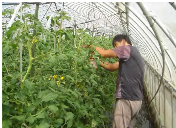
トマト栽培ハウス