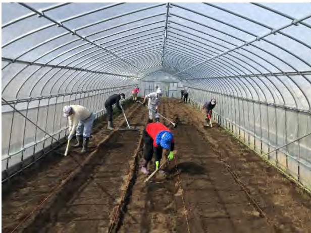
ビニールハウス内のベッド作成