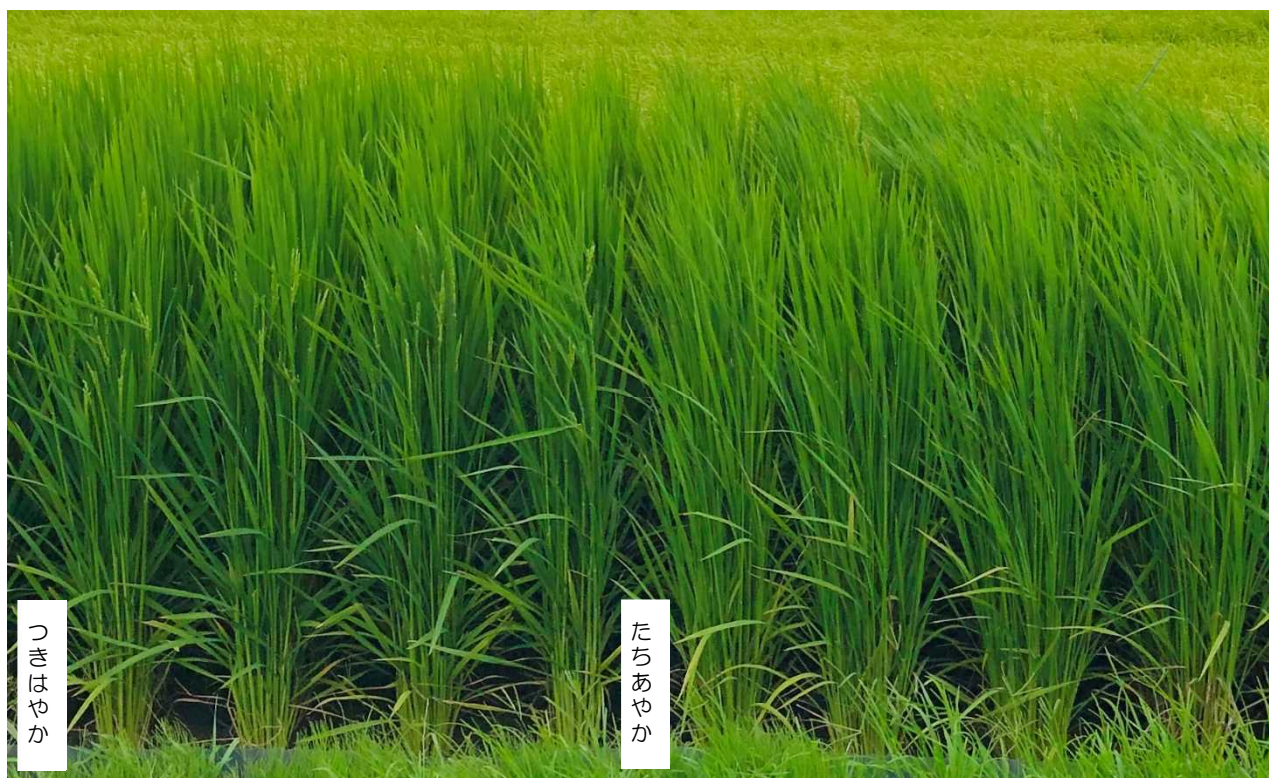
写真1 出穂期頃の「つきはやか」(左)と出穂前の「たちあやか」(右)