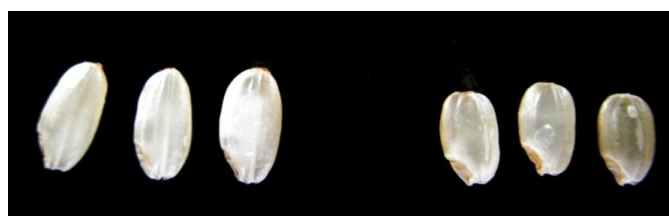
写真1 玄米の外観品質 (左:「べこあおば」 右:「ちば28号」)