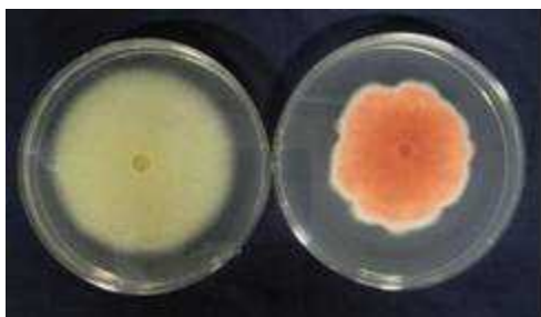
図 1 F. solani 分離菌株（左）及び F. oxysprum 分離菌株（右）の培養菌叢