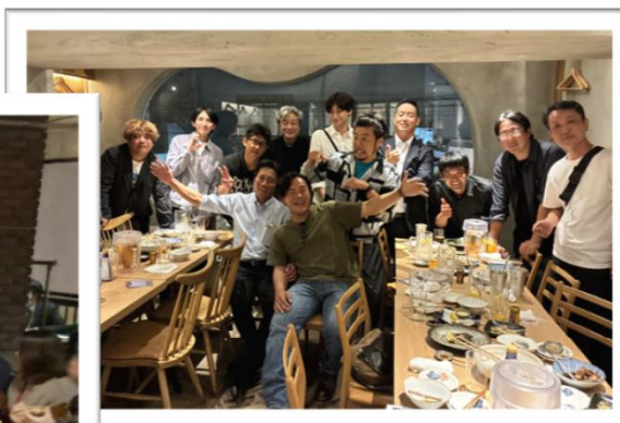
ちばアグリネットワークメンバー (一部)