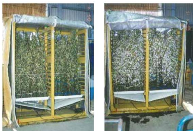
図 2 水稻育苗器による切り枝の開花促進の様子 注）左：ステージ 3 で搬入した状態（「長十郎」） 右：25℃で約 54 時間保温し、満開となった状態