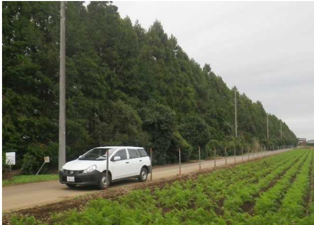
写真1 農業生産や生活環境を保全する機能を持った防風保安林（八街市）

森林は、木材を生産する機能のほか、二酸化炭素の吸収や生活環境の保全、防風や山地災害防止などの公益的な機能を発揮しており、災害に対して県民生活を守るものとして位置づけられてきた（写真1）。