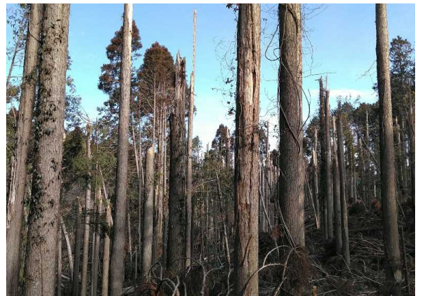
写真2 強風による風倒被害地

風倒被害（転倒や傾斜、幹折れ）は、一般的に下記に示した条件で発生しやすいことから、風倒木の発生により道路、電線等の重要インフラ施設に被害を与える可能性がある森林では、災害に強い新たな森づくりを進め、今後の災害に備える必要がある。