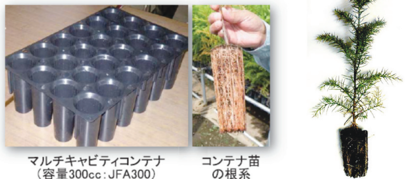
図3 コンテナとコンテナ苗の根系 (4)、スギのコンテナ苗 (5)