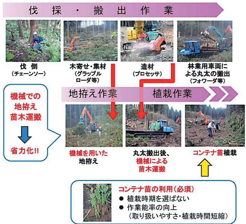
図2 一貫作業システムの流れ (3)

一貫作業システムは、路網が整備され車両系の林業機械を使用している場所で、木寄せ、集材を行うグラップルローダー等を地拵えに使用し、搬出を行うフォワーダ等を苗木運搬に使用することで、伐採、搬出から地拵え、植栽までを効率よく行うものです(図2)。なお、苗木には、植栽時期を選ばず、専用の器具により効率よく植栽できるコンテナ苗(図3)を使用します。この方法により、地拵えから植栽までの労力が、従来型の人力作業(26.4人日/ha)に比べて、13~17%(3.5~4.5人日/ha)に減らせることが明らかになっています。また、大苗を使用することにより、下刈り労力の軽減、さらにはニホンジカによる食害の軽減の可能性についても検討されています(6)。