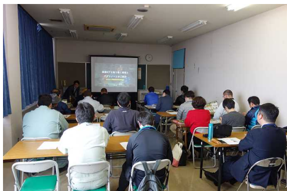
スマート農業の現状と展望についての講義

農業事務所では、今後も農業経営の大規模化等に対応して、スマート農業を活用した作業の効率化・省力化を支援していきます。