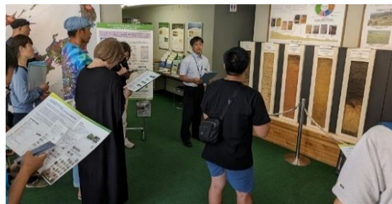
日本各地の土壌標本を見るセミナー生