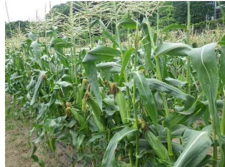
スイートコーン品種審査会（立毛）

3月播種6月どりスイートコーン（トンネル栽培）の優良品種は「味来 1364」、「THX-166」、「プレミアムスイート」、「MSG-1203」、「わくわくコーン 88」、「Y510R」です。各品種の特徴を紹介します。