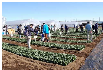
コマツナ品種審査会の様子

コマツナは周年を通じて安定した需要があり、冬どりの露地栽培でも収穫可能な、耐寒性が強く気候の変動を受けにくい、草勢の安定した品種が求められています。そこで、この作型を対象に「第65回千葉県野菜品種審査会」を開催し、収量性、外観品質等の良い優良品種の選定を行いました。審査結果や選定した優良品種の特性について紹介します。