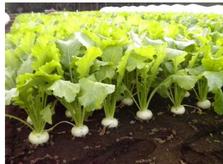
コカブ品種審査会 (立毛)

秋どりコカブでは、収量及び外観品質が良好なことに加えて、病害や障害の発生が少なく、かつ葉軸が強くて収穫調製作業のしやすい品種が望まれています。そこで、「第65回千葉県野菜品種審査会」を開催し、優良品種を選定しましたのでその審査結果を紹介します。