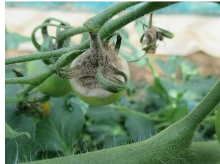
ミニトマト灰色かび病

「まもるんサリー」という結露センサー付き複合環境制御装置を用いて、ハウス内の湿度及び温度をコントロールし、ミニトマトを栽培し、好湿性病害の発生が抑えられるか試験しました。その結果、ミニトマト疫病、葉かび病、斑点病、灰色かび病が抑制できることが明らかとなりました。