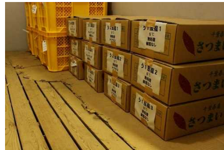
サツマイモの貯蔵試験

そこで、実際の船便輸送時の温度及び湿度条件を調査するとともに、輸出温度を模した状態を作り、ガス制御フィルム及びキュアリング処理が「べにはるか」の腐敗発生に及ぼす影響を検討しました。