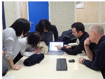
コンサルタントによる ICTの活用

オランダでは、産官学が連携して環境制御技術等の研究開発が進められ、最先端技術に精通したコンサルタントが生産現場への普及を行っています。また、農家はICTによる雇用管理、外部への作業委託など合理的な営農システムにより、世界に類を見ない効率的な施設野菜生産を行っています。千葉県で懸念される労働力不足への対応やスマート農業の推進に向け、オランダへの視察研修を実施しましたので報告します。