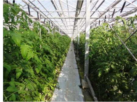
炭酸ガスを施用した促成トマト

農林総合研究センターでは収量 30%アップを目指した促成トマトの炭酸ガス施用技術の開発を行っています。生産者の圃場での調査結果を紹介するとともに、効率的な施用を行うためにはどのような点に注意すればよいか解説します。