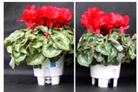
シクラメンの高温対策 (左：慣行区、右：簡易ミスト区)