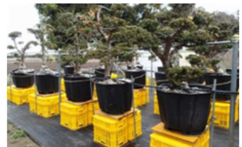
地上50cm隔離管理による オオハリセンチュウの再汚染の回避