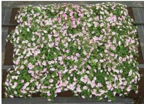
1等特別賞 「スーパーチュニア ラヴィドゥヴィ」

第67回全日本花卉品種審査会において、初夏花壇の植栽に使用するペチュニア優良品種として選定された5品種「スーパーチュニア ラヴィドゥヴィ」、「カラーラッシュホワイト」、「スーパーチュニア ビスタミニ クリスタル」、「スーパーチュニア ビスタ スノー」、「ビューティカル ボルドー」について、それぞれの特徴を紹介します。