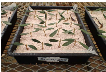
パーライトに挿したオリーブ

庭木や緑化樹等として人気のあるオリーブや常緑ヤマボウシは挿し木増殖での発根率が低い ため、計画的な生産が難しい樹種です。挿し木は発根するまでは非常に不安定な状態で、発根 するまでに穂木を枯死させないように好適な条件下に置く必要があります。そこで、それぞ れの樹種について発根率を向上させる挿し木条件を明らかにしました。今回は、発根率の安定化 に最適な挿し木の時期や灌水条件、光条件などを紹介します。