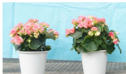
EOD-heating 処理時の電照時間の影響