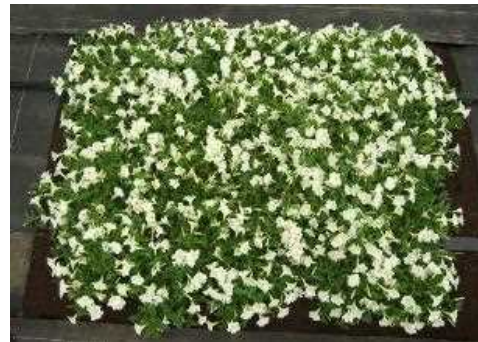
2等 「カラーラッシュホワイト」