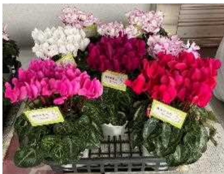
燃やせる土を用いて栽培したシクラメン

多くの自治体では「土」をごみとして捨てることができず、特にマンション住まいの世帯では、鉢花や寄せ植えの観賞後の鉢土の処分方法が問題となっています。そこで、焼却可能な資材を用い、可燃ごみとして捨てられる培養土（燃やせる土）を開発しました。今回は、燃やせる土に使用した資材、燃やせる土そのものの特徴、燃やせる土を使用したシクラメン栽培の方法、注意すべき点について紹介します。