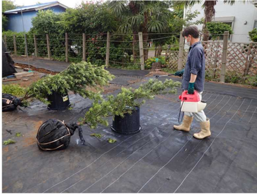
蒸散抑制剤の散布

植物検疫を通過するには、根部土壤除去（根洗い）によりセンチウ類を除去する必要があります。しかし、土壌を除去されたイヌマキは水分欠乏に陥りやすく、枯死葉の発生や落葉による商品価値の低下が問題となっています。そこで、葉の間引きや蒸散抑制剤の散布により、蒸散量を抑制し、樹体の水分を維持できるか検証しましたので、その結果を紹介します。