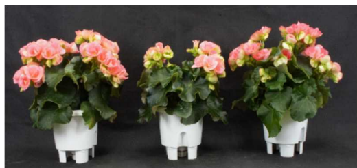
EOD-heating 処理時の昇温時間の影響

千葉県農林総合研究センターではヒートポンプを活用したエラチオール・ベゴニアの周年安定生産技術の開発に取り組んできました。一昨年度は秋期出荷を対象とした夜間冷房方法についてお話しましたが、今回は冬期出荷を対象に、暖房コストを削減するための変温管理（EOD-heating）や電照方法について紹介します。