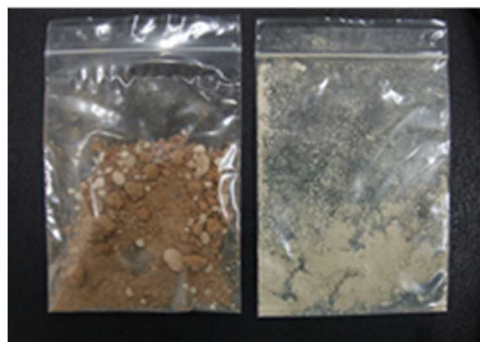
600℃ 4時間燃焼させた場合の灰 (左：慣行土、右：燃やせる土)