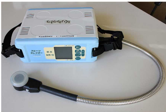
携帯型近赤外分光装置

そこで、携帯型近赤外分光装置を使ってサツマイモを切断することなく、短時間に充実度を測定できる方法を開発しました。