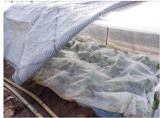
遮光ネットとべたがけを利用した「べにはるか」苗の育苗の様子