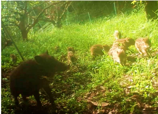
山に生息するイノシシの群れ

イノシシ被害対策として、①生息環境の管理、②防護柵の設置、③捕獲が有効とされていますが、全ての圃場に対策を行うのは労力とコストがかかります。そこで、令和元年～3年に南房総市で行った水稻のイノシシ被害調査の結果から、被害の出やすい圃場周辺の景観構造を整理し、対策を優先すべき圃場の環境要因を明らかにしたので紹介します。