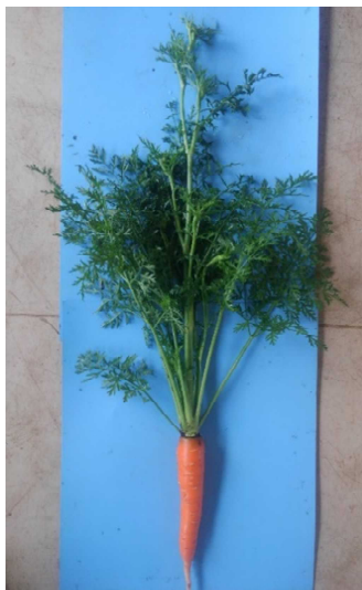
抽台したニンジン

春夏どりニンジンのトンネル栽培において、2月中下旬に播種し、6月下旬から7月上旬にかけて収穫すると収穫時期に抽台が発生しやすく、年や圃場によって問題となります。抽台の発生には温度が影響することからトンネル除去時期に着目して試験を行い、現地の慣行よりもやや早い、6葉期（4月20日頃）にトンネルを除去することで、根部の肥大を抑制せずに抽台の発生を軽減することを明らかにしました。