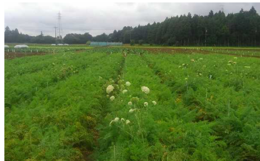
圃場での抽台発生の様子