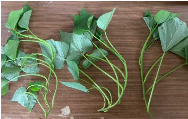
曲がりのある「べにはるか」苗（左、中央）と、良好な苗（右）

近年、サツマイモの育苗は、ウイルスフリー苗を利用したポット苗育苗が主流となっています。千葉県的主力品種「べにはるか」は伸長速度が遅く、増殖効率が低いことに加え、節が多く、曲がった苗になりやすいことが問題となっています。そこで、今回は「べにはるか」のポット苗育苗における苗質及び苗の増殖効率を向上させる栽植方法、採苗方法、温度管理方法等を紹介します。