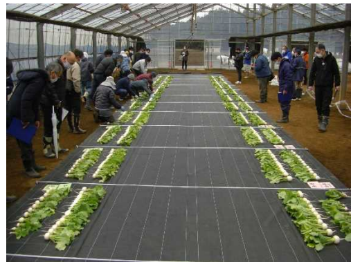
収穫物審査の風景