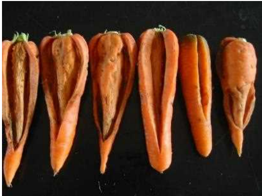
乾腐病による激しい裂開症状

千葉県のカニンジン栽培では、乾腐病としみ腐病による根部しみ症被害が問題となっています。いずれの病気も土の中の病原菌が原因ですが、土壌消毒だけでは被害を十分に防ぎきれないケースがあります。そこで、秋冬どり栽培における乾腐病の発生しにくい品種を明らかにしました。また、春夏どり栽培では、土壌消毒に加えて病気の発生しにくい品種及び播種時期をずらすことでしみ症被害を軽減できることを紹介します。