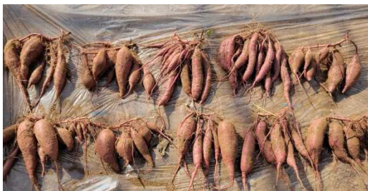
収穫した「シルクスweet」

焼きいも需要の高まりから、粘質系サツマイモ「シルクスweet」の栽培面積が増加しています。しかし、「シルクスweet」を貯蔵した時の甘さ及び肉質の推移は不明でした。そこで、「シルクスweet」の貯蔵に伴う食味変化を調査し、併せて「シルクスweet」の食味関連成分を明らかにしましたので紹介します。