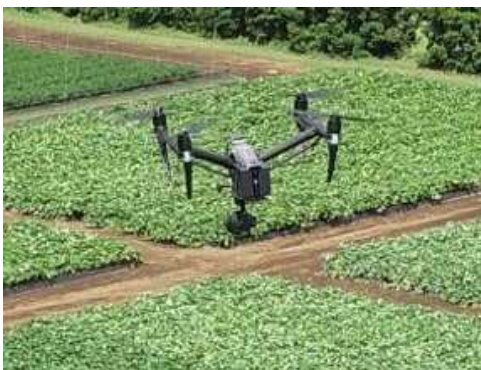
ドローンによる空撮

ドローンを用いたサツマイモ試験の取り組み状況を紹介します。ドローンによる空撮画像の解析データから得られる情報の数々（植被率、草高、植生指数等）の中から、サツマイモの草勢評価に有効な指標について解説します。