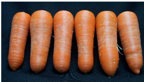
貯蔵後のニンジン

そこで、11～1月に収穫した秋冬ニンジンを端境期まで貯蔵し、品質の変化を調べ、適切な収穫時期及び温度、品種等を明らかにしました。