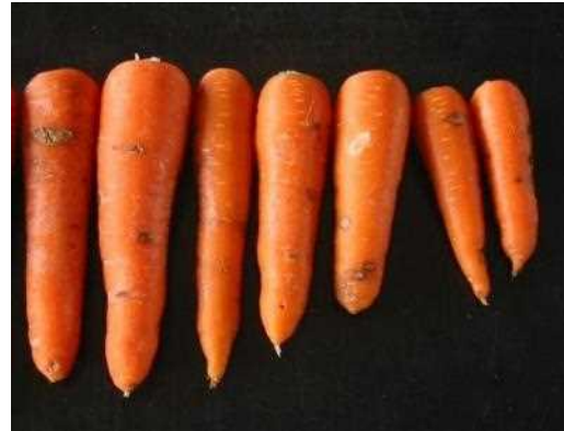
両病害に共通するしみ症状