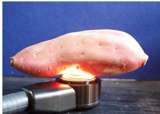
非破壊測定の様子