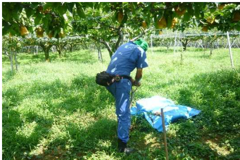
樹園地の土壌調査の様子

平成29年度～令和2年度に、県内の樹園地18地点の土壌調査及び土壌管理に関するアンケート調査を実施しました。そして、過去の調査結果との比較から、農耕地土壌の変化を明らかにしました。樹園地では、高pH、交換性陽イオン含量及び可給態リン酸含量が過剰な地点が多くありました。また、地力の指標である可給態窒素含量は減少していました。土壌診断に基づく適正施肥が必要です。