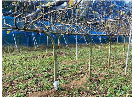
ナシのジョイント仕立て