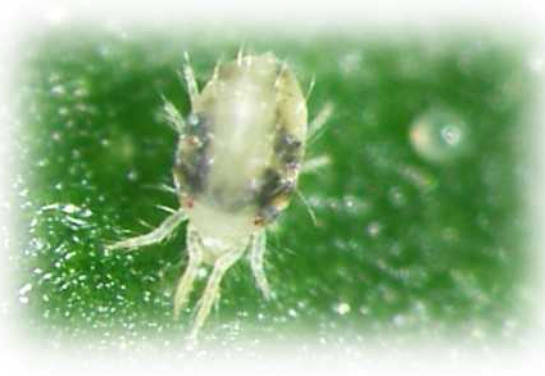
ナミハダニ雌成虫

ナシ園で株元草生栽培やカブリダニ類に優しい殺虫剤を選択して使うことで、土着天敵のカブリダニが働くようになり、殺ダニ剤1回までの使用でハダニを抑えられるようになります。本技術は現地での導入も始まっています。その成果を IPM (総合的害虫管理) 版ナシ害虫防除暦としてまとめましたので、紹介します。