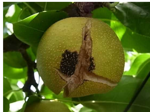
黒星病による裂果