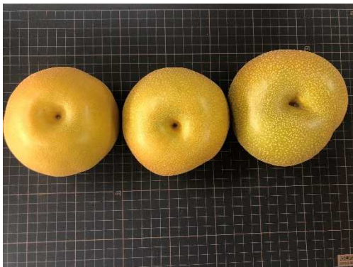
貯蔵直前の熟度別の果実

ナシの輸出に関するこれまでの研究から、鮮度保持剤である1-MCPと冷蔵の併用により、「豊水」では40日程度の鮮度保持が可能であることが明らかになっています。一方で、現在輸出されている果実の熟度は国内流通用であり、そのため1-MCPの鮮度保持効果がやや弱く、常温の貯蔵期間が長い場合には障害果の発生も懸念されます。今回、熟度を抑えた果実を使用して「豊水」の鮮度保持期間を60日程度に延長できる技術を開発したので紹介します。