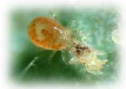
ナミハダニを捕食するミヤコカブリダニ雌成虫