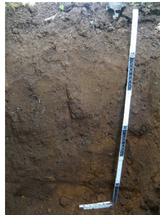
ナシ園（黒ボク土）の土壌断面