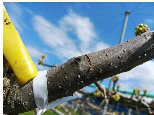
「秋満月」への目傷処理