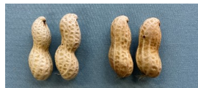
ゆで落花生の外観 (左:Qなっつ 右:郷の香)