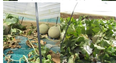
白黒ダブルマルチによる萎れ抑制 (左:慣行 右:白黒ダブル)