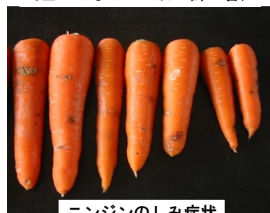
ニンジン根のしみ症状

※新型コロナウイルス感染拡大防止の観点から、以下に該当する場合には 入場制限を実施することになりますので、御留意ください。