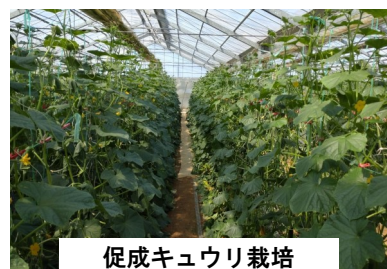
促成キュウリ栽培