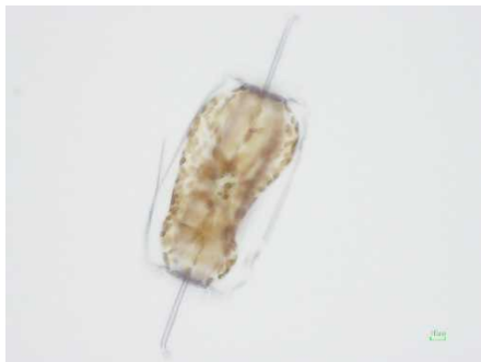
図1 ディチルム属 (2/19 富津南)