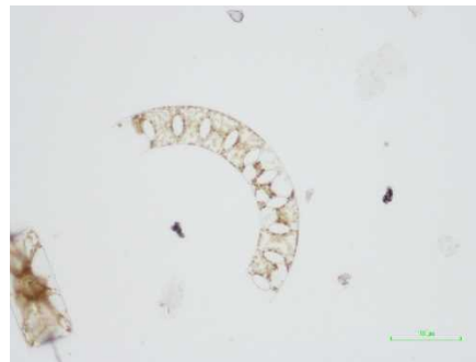
図2 ユーカンピア属 (2/20 浦賀水道)