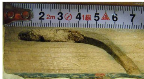
スギカミキリの幼虫による被害