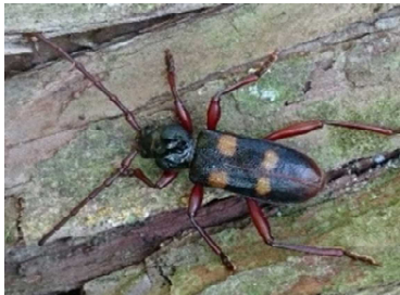
スギカミキリの成虫