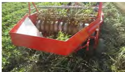
掘り上げ反転収穫機