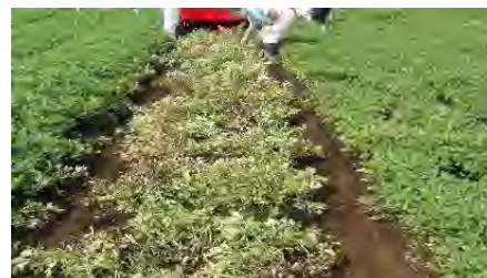
収穫機による反転の様子