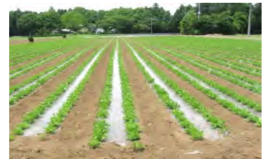
播種1か月後の出芽状況