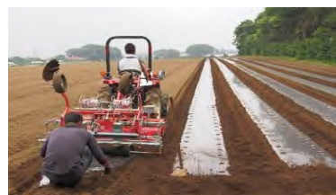
播種と同時にフィルムを張る様子