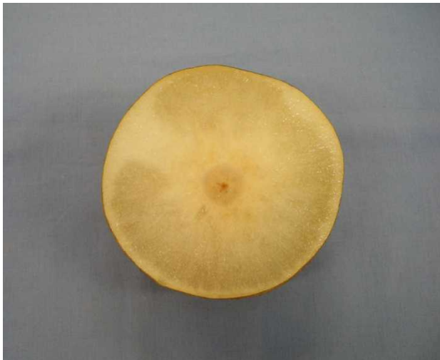
写真2 ジベレリンを満開後44日に果梗に塗布して発生した育成系統「1-H7-6」のみつ症重症果の横断面 (2010年)

「豊水」の樹ごとのジベレリン塗布と無処理のみつ症重症果の発生の関係を第1図に示した。各供試樹においてGA区のみつ症重症果率は43~89%、無処理区は11~67%