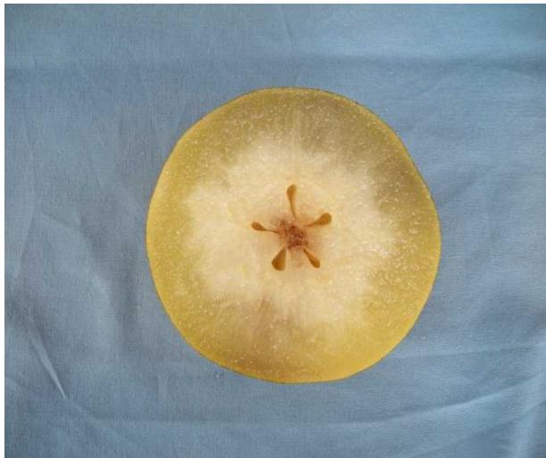
写真1 ジベレリンを満開後44日に果梗に塗布して発生した「豊水」のみつ症重症果の横断面(2009年)

ジベレリンの塗布時期がみつ症の発生に及ぼす影響を第2表に示した。みつ症の平均指数は、「豊水」と「ゴールド二十世紀」ではGA44区がそれぞれ1.71, 1.94と最も高く他のGA各区も無処理区に比較し高かったが、その他の品種のGA各区は無処理区と大差ないか無処理区に比較し低かった。みつ症重症果率は、「豊水」ではGA30～