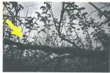
写真3 ナシ炭疽病により早期落葉したナシ樹