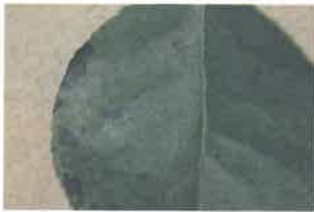
写真1 ナシ炭疽病による微小黒点

(1) 病徴：はじめ葉身及び葉柄に直径0.5～1 mmの微小黒点を生じた（写真1）。その後、葉身における病斑は2 cm程度の大型病斑に進展した。複数の病斑が融合して大型病斑となる場合もあった。進展した大型病斑の中心部分は灰褐色となり、黒い粒状の分生子層が形成された（写真2）。その後、葉は次第に黄化し、落葉した（写真3）。また、発生のおくは果叢葉から始まり、徒長枝へ進展する傾向があった。果実に病斑はみられなかった。