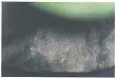
写真2 ナシ炭疽病の大型病斑