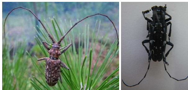
写真 1 (左) マツノマダラカミキリ

このように病害虫は今後も増えることが予想されるため、行政、研究、現場が一体となった防除体制の整備と、新たな知見を速やかに得られるように研究機関同士の連携を密にすることが大切だと思います。