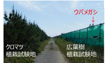
写真 1 植栽 7 年後のクロマツとウバメガシの樹高

しかし、広葉樹にも有利な点があります。それは下刈りを省略できることです。この試験地では下刈りの有無で成長の比較をしたところ、差はみられず、下刈りをしない方が樹高が高かった樹種もありました。クロマツは下刈りが必須なので、この点についてはクロマツよりも広葉樹の方が経費と労力を削減することができます。