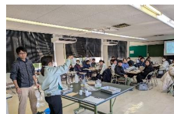
試験研究と普及の技術交流

また農家で生産された自給飼料の分析と飼料給与等の指導を行う、自給飼料分析指導センターを運営しています。