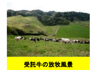
受託牛の放牧風景

さらに食と農の教育の充実を図るため、児童生徒の体験学習の場として社会科見学を受け入れています。