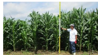
飼料用トウモロコシ収穫調査