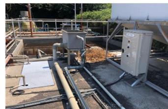
汚泥自動制御装置