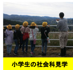
小学生の社会科見学