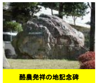
酪農発祥の地記念碑

現在は、受精卵の効率的利用技術等に関する研究のほか、乳用牛の改良増殖を図るため、優良な乳用牛の受精卵を供給しています。さらに県南部における飼料生産技術に関する研究を行っています。