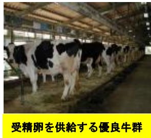
受精卵を供給する優良牛群