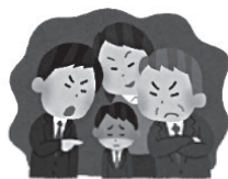
令和5年度 男性相談 電話相談内容内訳