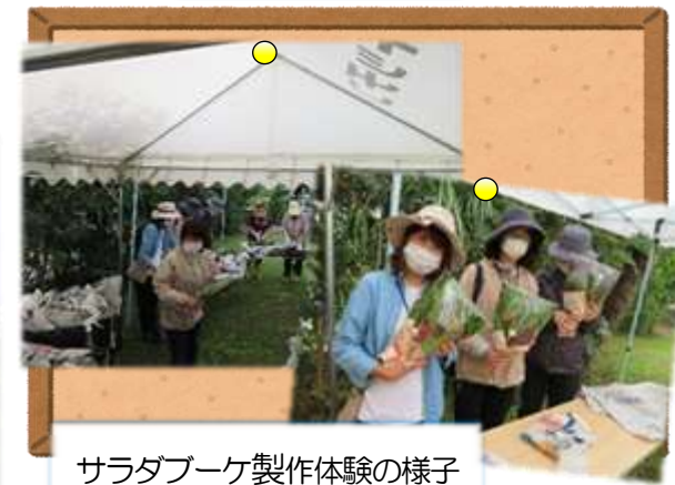
サラダブーケ製作体験の様子

お昼はタンジョウファームキッチンで、当講座オリジナルのランチプレートをいただきました。