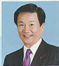
千葉県選手団団長 千葉県知事