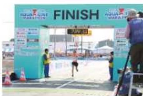
フィニッシュテープ係