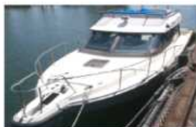
千葉県港湾監視船