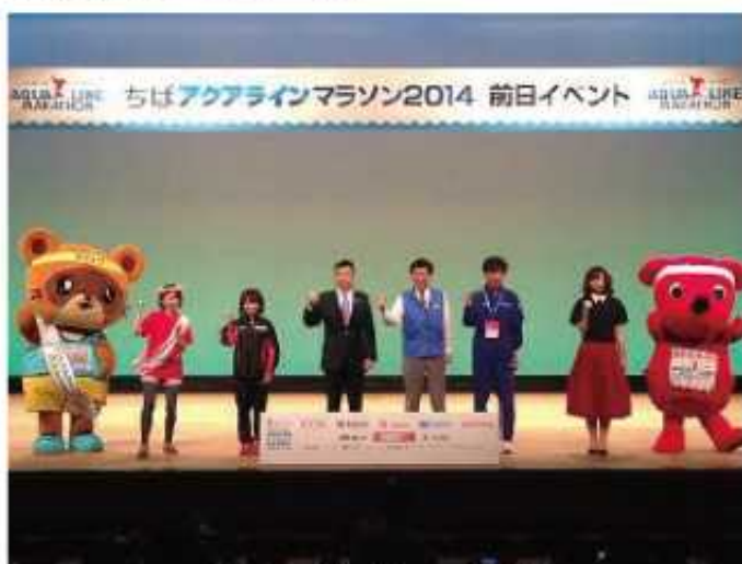
スペシャルトークショー出演者

開催日: 平成26年10月18日(土) 10時30分~15時40分 場 所: 木更津市民会館大ホール 出演者: 森田知事、渡辺木更津市長、 千葉PR大使、吉木PR大使、 岡村招待選手、佐伯招待選手他 内 容: スペシャルトークショー、エチオピアダンス、 ご当地キャラクター応援団ショー 大塚製薬水分補給セミナー 高校生・幼稚園児によるステージほか