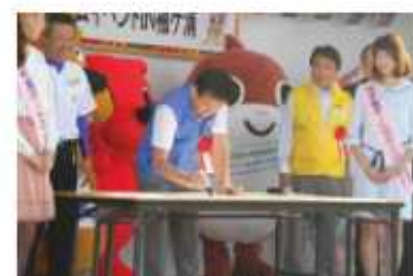
メッセージボード筆入れ

※大会前日・当日に行われた「袖ヶ浦おもてなしゾーン」 及び「袖ヶ浦おもてなしパーク」の詳細はp.44参照