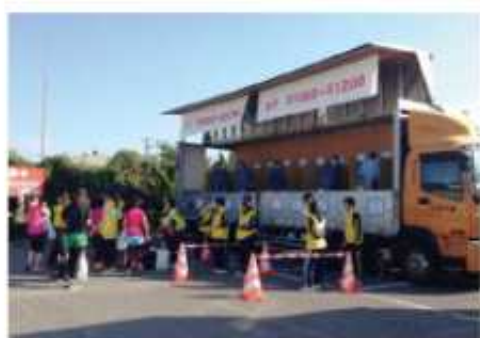
ハーフ手荷物預かり