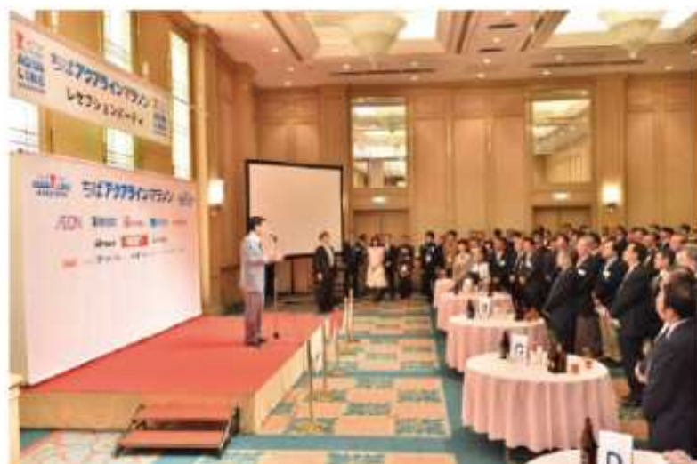
レセプション風景