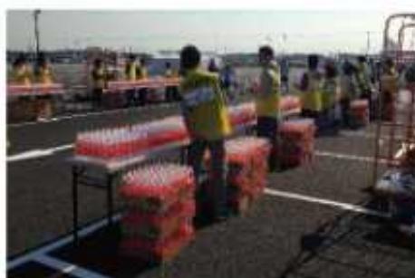
フィニッシュ後の給水(ハーフマラソン)