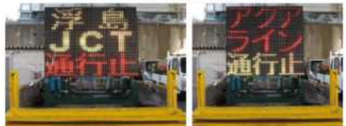
高速道路交通規制表示内容