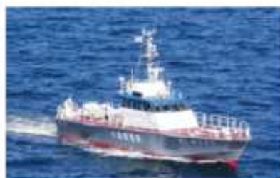
千葉県警察水上警察隊警備艇