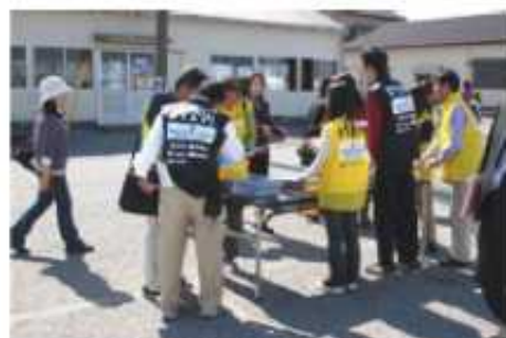
総合案内・外国語対応