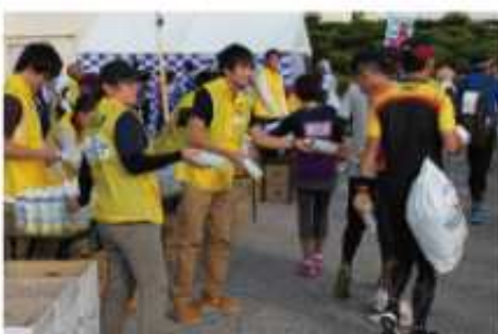
フィニッシュ後の給水