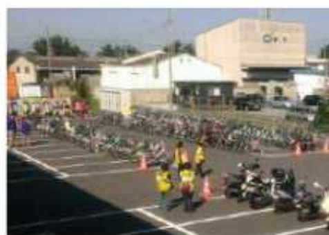
駐輪場(トップサイド)