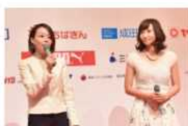
千葉PR大使、吉木PR大使インタビュー