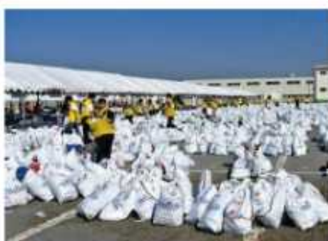
フル手荷物預かり