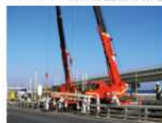
アクアライン橋梁部養生作業②