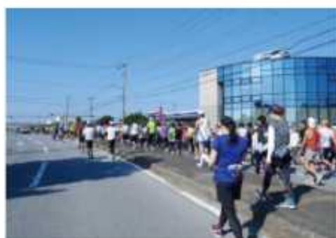
スタート整列に向かうランナー