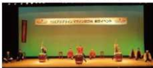
木更津総合高校和太鼓部パフォーマンス

※大会前日・当日に行われたメイン会場イベント(「わくわくイベント広場」 「魅力いっぱいギョッ♥と千葉屋台村」詳細はp.40~42参照)