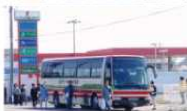
来場者用シャトルバス(トップサイド ~日本質貨保証併臨時駐車場)