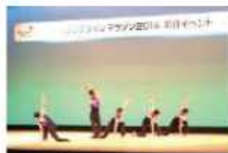
袖ヶ浦高校男子新体操部ステージ

※大会前日・当日に行われたメイン会場イベント(「わくわくイベント広場」 「魅力いっぱいギョッ♥と千葉屋台村」詳細はp.40~42参照)