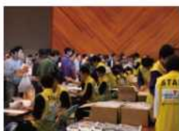
ボランティアによる受付