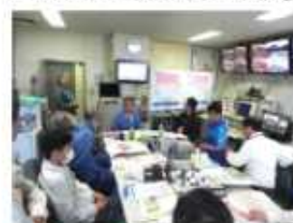
アクアライン本部