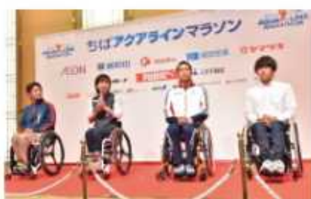
車いすハーフマラソンエキシビジョン 招待選手インタビュー

開催日：平成26年10月18日(土)16時～18時 場所：オークラアカデミアパークホテル 参加者：実行委員会、県関係者、招待選手4名、 車いすハーフマラソンエキシビジョン 招待選手4名、千葉PR大使、 吉木PR大使、スポンサー(約100人)