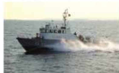
海上保安庁木更津海上保安署巡視船