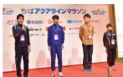
招待選手インタビュー

開催日：平成26年10月18日(土)16時～18時 場所：オークラアカデミアパークホテル 参加者：実行委員会、県関係者、招待選手4名、 車いすハーフマラソンエキシビジョン 招待選手4名、千葉PR大使、 吉木PR大使、スポンサー(約100人)