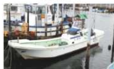
金田漁業協同組合 協力船舶