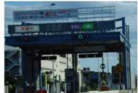
首都高管内横断幕