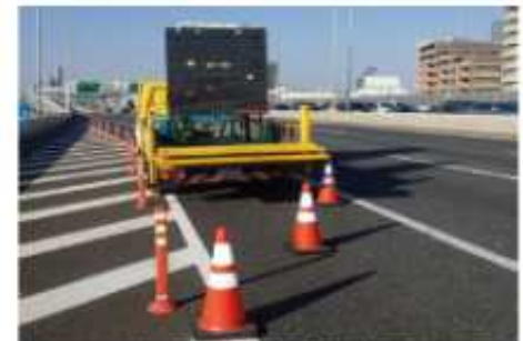
高速道路交通規制表示