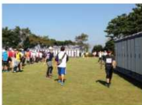
仮設トイレ(潮浜公園)