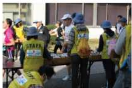
フィニッシュ後の給食