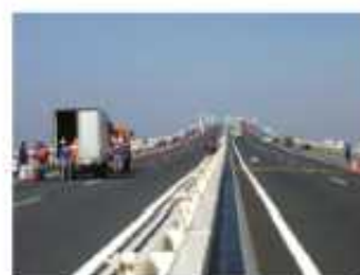
アクアライン橋梁部養生作業①