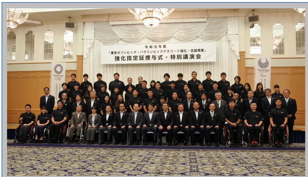
【指定選手との集合写真】