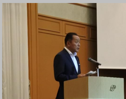
【阿井県議会議長の挨拶】