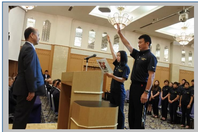
【代表による選手宣誓】