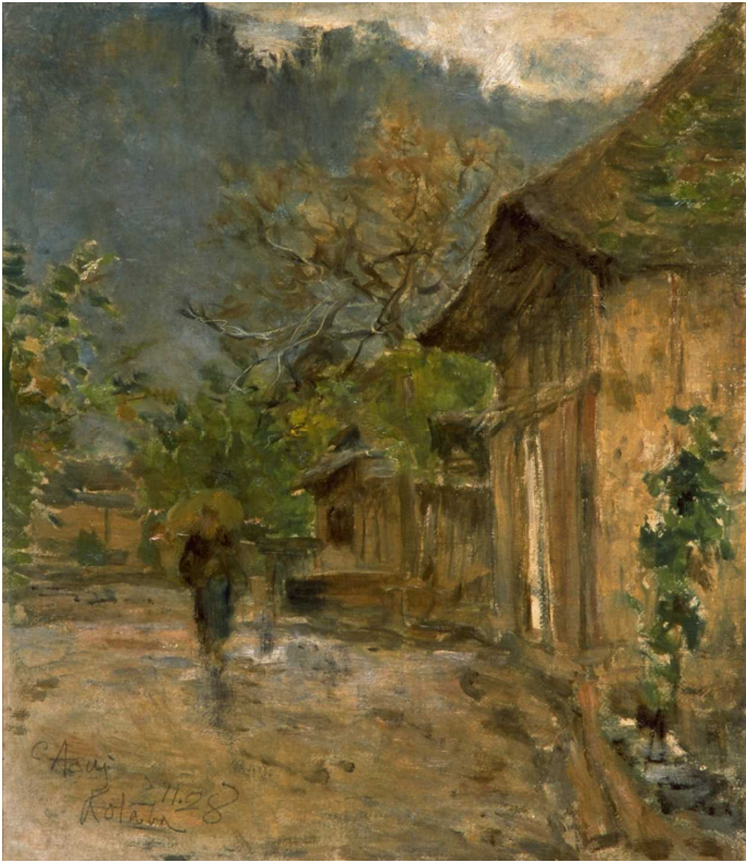
新指定-① 小丹波村〔浅井忠筆〕