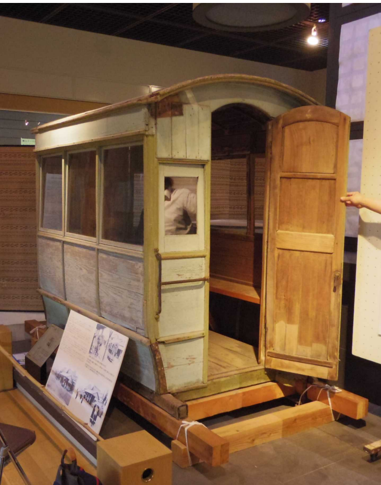
新指定-④ 茂原庁南間人車軌道人車