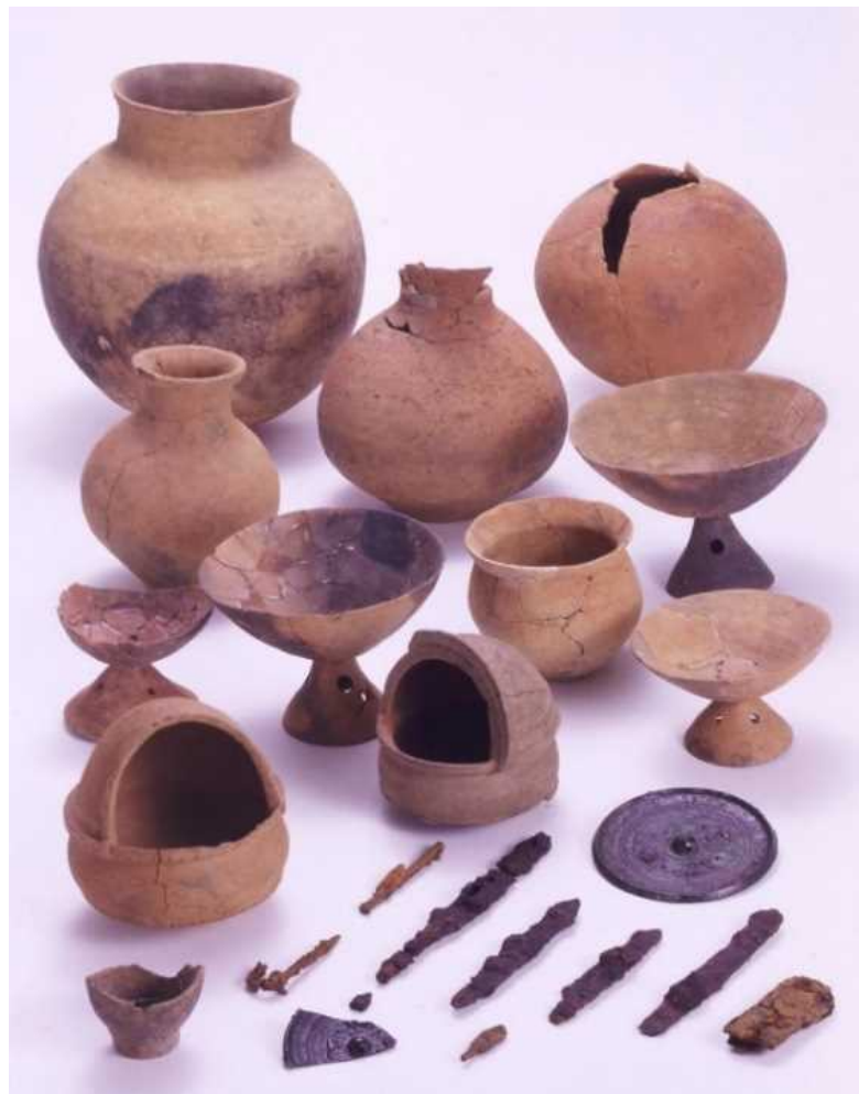
新指定-⑥ 高部30号墳・32号墳出土品