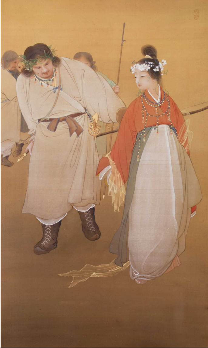
新指定-② 木華開耶媛〔石井林響筆〕