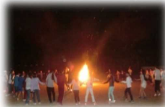
火を囲み楽しかった キャンプファイヤー！

「睦岡小学校支援地域本部」では、学校の環境整備、登下校の見守り、野外活動などを行っています。