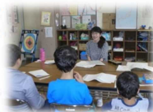
地域ボランティアの方と プリントを使って学習

そこで、四街道市国際交流協会のご紹介のもと、地域ボランティアの方に日本語指導をお手伝いしていただいています。外国籍の子供たちが日本語に親しみ、安心して学校で過ごせるよう、学校と地域のよりよい連携を進めていきたいと思ひます。