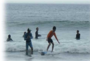
サーフィンの様子 短時間でここまで上達！！

子供たちにとって初めてのサーフィン体験でしたが、最初は不安そうな表情を浮かべる子が多かったものの、すぐに波に乗り、どんどん上達していきました。天津の ふた 夕間海岸の波がサーフィンに適していることも学びました。