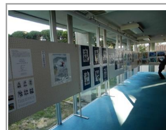
文化協会主催の児童作品展