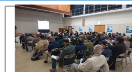
コロナ前の講座の様子。人々の「つどい」の場

各種の公民館教室や館の環境整備を通して、「使いやすい」「明るい」生涯学習の場としての公民館にすることを目指している。利用者のニーズに応じて事業を考え、コロナ禍であっても安全に学び、活動できる環境の整備を心掛けている。これからの「withコロナ」の社会に向けて、人々の「つどい」の場として、地域の歴史・文化・芸術の活動の拠点でありたい。