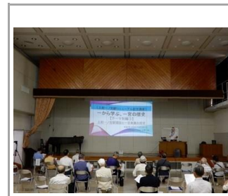
文化財講座の開催(2020)

コロナ禍でイベントの多くが中止となり、発表の場が限られたことを受け、町内の小学校の子どもの作品を公民館1階ロビーで展示。学校や文化協会、社会福祉協議会と連携しながら、それぞれが行っている作品展などの事業の展示会場として公民館を提供した。