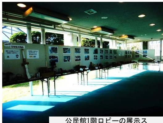
公民館1階ロビーの展示ス