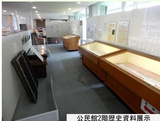
公民館2階歴史資料展示