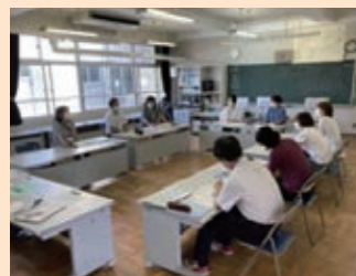
初回は対面で実施

初回は対面で、次回からはオンラインを活用して複数回行うことができ、連携が深まってきた。