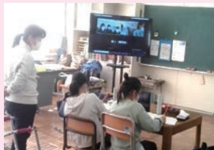
県立特別支援学校の「文化祭の様子」を真剣に視聴している。