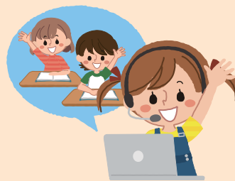
在籍学級の他の児童と対話

部屋の広さや、音の刺激等、環境を調整すれば不安等が軽減し、落ち着いて参加できることがわかり、意欲的に学習ができるようになってきた。