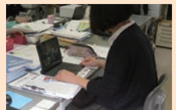
在籍学級担任が、自立活動の 指導を授業参観中