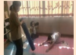
PCの画面を見ながら 楽しくストレッチ

オンラインを活用して、特別支援学級在籍児童が、特別支援学校の専門性の高い教師から、直接、ストレッチの仕方について指導を受けた。児童の身体の動きを見た担任に気づき生まれ、ストレッチメニューの見直しにつながった。