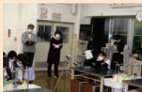
自立活動の指導を参観中

弱視通級指導教室から、オンラインを活用して、他校通級の児童に対し、「タブレットPCを見やすい設定に変えよう」という自立活動の指導を行った。在籍校の管理職を始め多くの教師が、授業参観をした。自立活動の意義が校内に広まる良い機会となった。