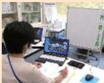
各学校から授業参観

言語障害通級指導教室での指導の様子を、オンラインを活用して、市内関係学校に配信した。担当教師等は、授業参観後、評価シートやアンケート等を活用して、意見交換を行い貴重な研修の場となった。