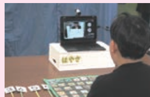
担当教師の舌の動きを見ながら、練習している。