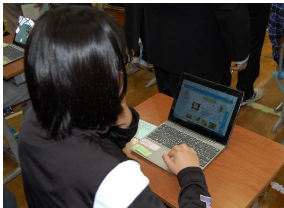
【発表ノートを使った活動】