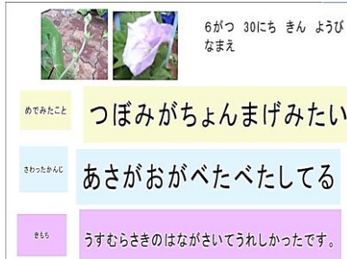
写真撮影+手書きパッド機能で文字入力