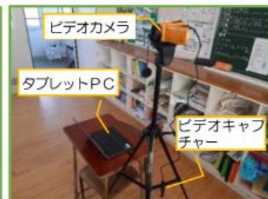
準備物 (教室の後方に設置)