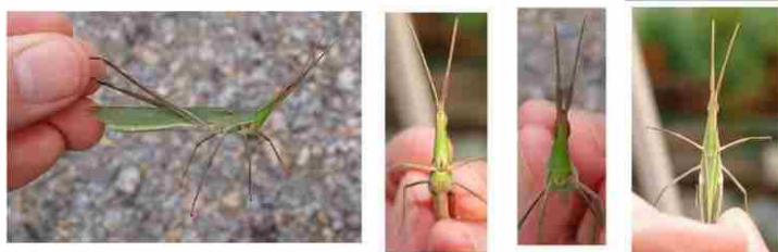
ショウリョウバッタの雄（おす）