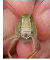
トノサマバッタの雄 (おす)