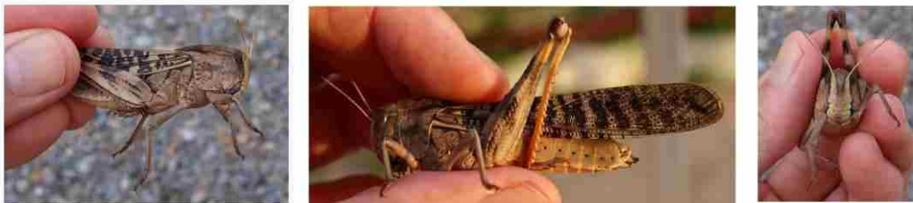
トノサマバッタの雌（めす）